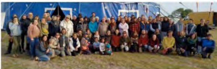
→ Une centaine de personnes ont œuvré en coulisses pour la bonne marche de l'événement. L'équipe organisatrice ayant réussi à fédérer plus de 80 bénévoles.