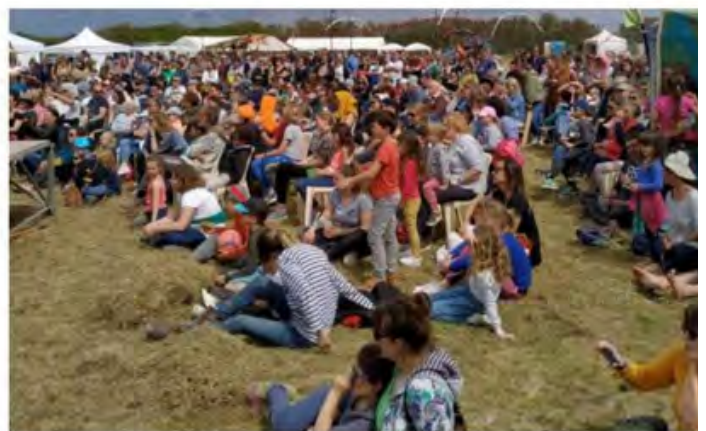
→ La belle météo a joué le jeu tout le week-end, même si une petite fraîcheur a fait un bref passage samedi soir.

nisation était parfaite et ça mérite d'être mentionné pour cette première édition quand on sait à quel point il est difficile de coordonner un tel événement.