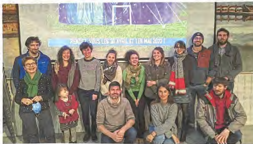
→ Dimanche, le conseil d'administration a présenté le projet dans la salle polyvalente.

Au cours du week-end, du samedi au début d'après-midi et jusqu'au dimanche en fin de