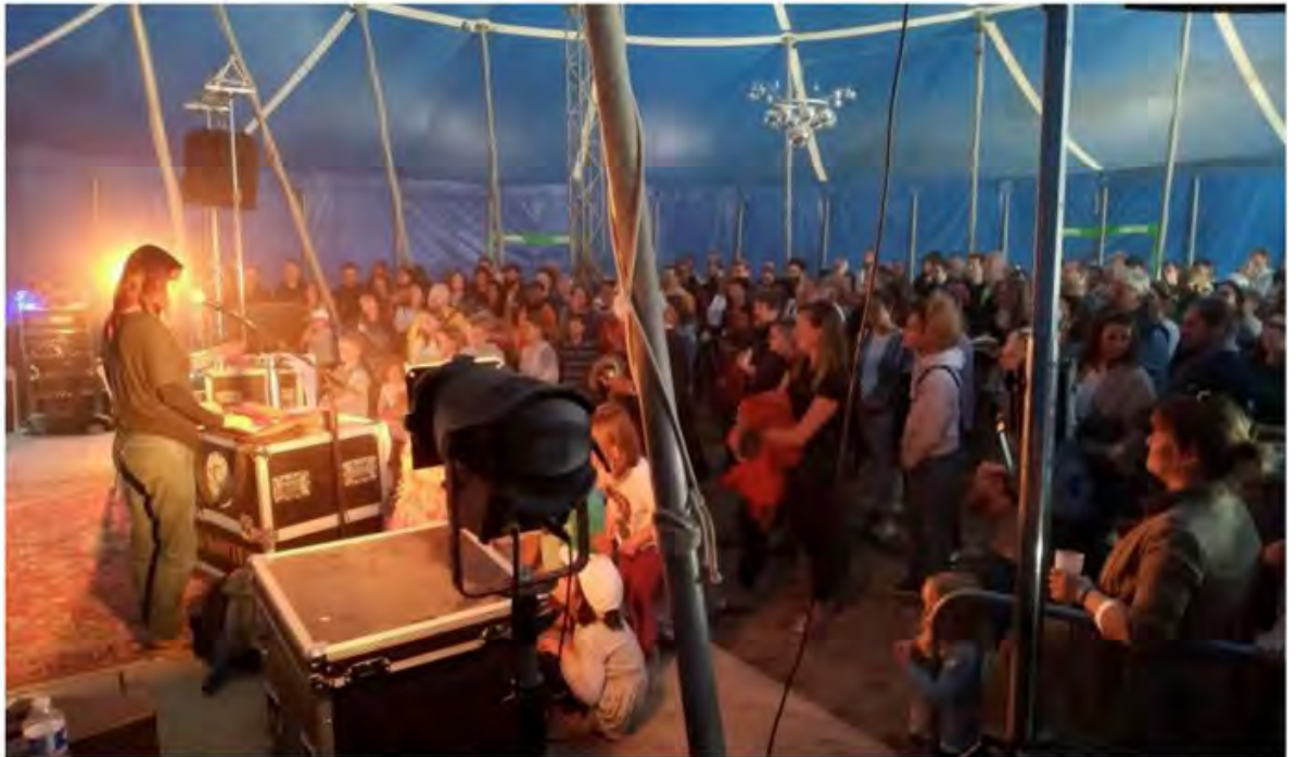
→ Les concerts sous chapiteau ont réuni à chaque fois plusieurs centaines de spectateurs.