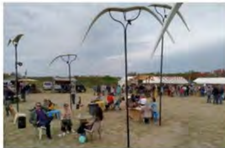
→ La scénographie mise en place donnait envie de se promener sur le site, de flâner, de partager, de se rencontrer, de se reposer. Bref, un week-end très agréable.