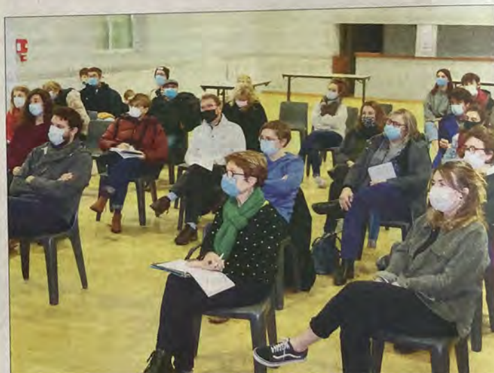
Ils sont une trentaine à avoir répondu à l'appel des organisateurs, mais l'équipe espère l'apport de nouveaux volontaires. C'est intergénérationnel et la bonne humeur est de rigueur.

Sous un chapiteau monté pour l'occasion, de nombreux concerts seront organisés dans tous les genres de musique. En extérieur, ce sont les arts de la rue qui seront à l'honneur avec de la danse, des acrobaties, du cirque et un spectacle scénographique, préparé par Raphaëlle Weber, sera également présenté. Le dimanche matin, et pendant toute la journée de dimanche, un marché regroupant une vingtaine de producteurs et d'artisans locaux permettra aux visiteurs de découvrir de bons produits tout en profitant du spectacle de rue. Pour organiser tout cela il faut des bénévoles. Contact: Lucille Formelle au 0633 69 69 37 ou Alice Godefroy au 06 81 56 38 49.